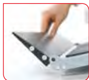
La rampe intégrée peut être repliée vers le haut pour un transport sans problème.

Après la pesée, la seca 677 se replie et se range en deux temps trois mouvements. Le dispositif d'arrêt fixe entre le garde-corps et le plateau confère une grande stabilité à la balance même une fois pliée. De plus, la main courante servant alors de poignée, la seca 677 se déplace facilement sur ses roulettes, sans qu'un effort physique soit nécessaire. Elle peut donc être transportée et rangée rapidement.