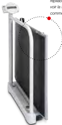
La balance est repliable pour pouvoir la transporter commodément.

L'écran pivotant placé à hauteur des hanches assure un grand confort d'utilisation au médecin et au personnel soignant. Après la pesée, ce dernier peut d'abord s'occuper tranquillement du patient, sachant que grâce à la fonction HOLD, le résultat de la mesure reste en mémoire. Une simple pression sur la touche TARE permet de prendre en compte le poids de tous les équipements auxiliaires, tels que siège ou fauteuil roulant, utilisés. La balance possède en outre une fonction IMC / BMI.