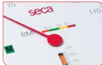
Le disque subdivisé en secteurs de différentes couleurs permet d'évaluer facilement le BMI.

Le design de cette balance allie élégance, fonctionnalité et ergonomie judicieuse. La lecture du poids sur le grand cadran rond incliné vers l'utilisateur est particulièrement commode. Grâce à son plateau très bas, la seca 756 est facilement accessible. Ses dimensions sont propres à permettre une pesée confortable des personnes de grande taille ou obèses. Par ailleurs, le plateau est revêtu d'un tapis de caoutchouc antidérapant pour leur sécurité.