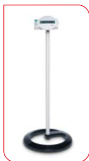
Statif pour modules d'affichage des balances seca télécommandés par câble.