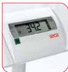
Le BMI du patient peut être calculé après avoir entré sa taille.

La fonction Indice de Masse Corporelle (BMI) de la balance seca 635 permet de déterminer facilement le statut nutritionnel du patient afin de prendre des mesures précoces. L'extinction automatique intégrée éteint automatiquement la balance après utilisation lorsqu'elle est alimentée par piles afin de prévenir toute consommation d'énergie inutile.