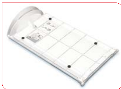
Le mécanisme pliable garantit une longue durée de vie.

Le stadiomètre seca 417 est l'outil idéal pour une utilisation mobile. Au cours des examens, le personnel médical doit contrôler l'état nutritionnel et le développement de nourrissons et de jeunes enfants. Pour le faire aussi rapidement que possible, une lecture facile des résultats est importante. Les marquages rouges et l'échelle graduée ne s'estomperont pas, même après des années d'utilisation intense.