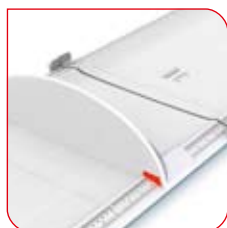
La lecture du résultat est facile à lire sur la grande échelle.

Les deux parties de la toise seca 417 sont reliées par une charnière. La toise est également dotée d'un appuie-tête intégral et d'un appuie-pieds coulissant sur des rails légèrement surélevés. Pour réaliser une mesure précise, il suffit à l'utilisateur de positionner la tête de l'enfant contre l'appuie-tête, d'étirer les jambes et de glisser l'appuie-pieds jusqu'au contact avec la plante des pieds.