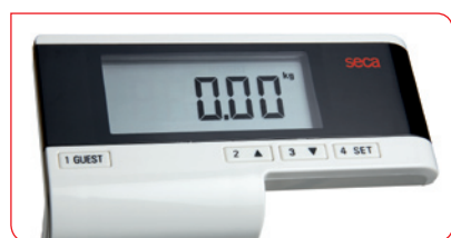
Lecture particulièrement commode du poids sur l'unité d'affichage placée sur la colonne.

Le plateau en verre est revêtu d'une couche homogène et transparente d'oxyde d'indium et d'étain (ITO) conducteur qui garantit un contact permanent de la peau pendant la mesure, pour des résultats extrêmement précis. La mise en marche est tout aussi simple : il suffit de sélectionner l'utilisateur sur l'unité d'affichage car la balance mémorise les données individuelles. Vous voyez qu'une balance seca est conçue pour satisfaire les plus exigeants.